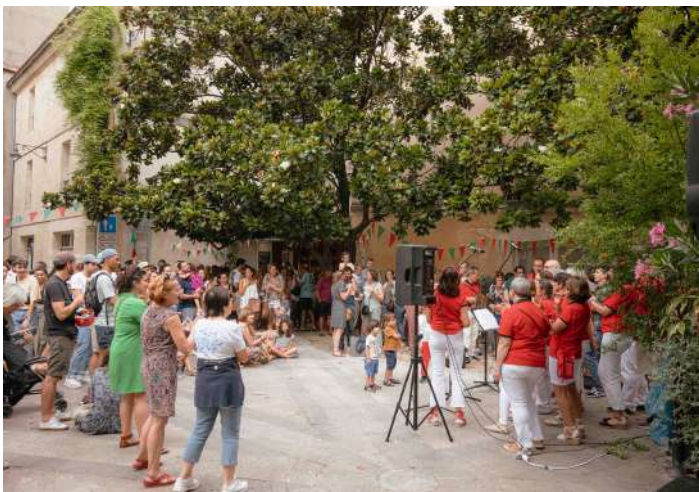
Fête de la Musique, juin 2022

Notre groupe d'animation musicale "Kantuz" anime l'ensemble de nos évènements. Il constitue une formidable vitrine pour la culture basque.