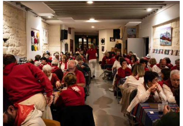
Repas cidrerie, avril 2022

La Maison Basque propose et / ou participe à de nombreux évènements. Elle produit des spectacles, des concerts (en 2022 : Rebotu au Femina de Bordeaux et Kalakan à la salle des fêtes du Grand Parc). A l'occasion de la Fête de la Musique, la place des Basques est devenue un des rendez-vous préférés des bordelais. Elle tient un stand sur les 4 jours de la Fête du Vin, valorisant les produits du Pays Basque et sa culture festive. Parmi les manifestations récurrentes, deux fois par an, les repas cidrerie sont toujours très appréciés.