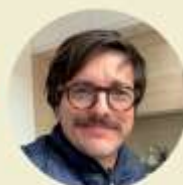
Laurent Pétriat Déclarations sociales, salaires