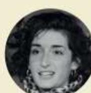
Léna Bonion Agencement des locaux