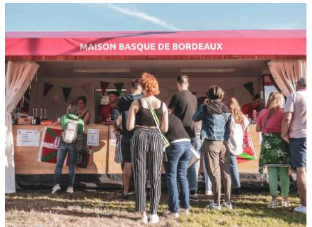
Fête du vin, juin 2022